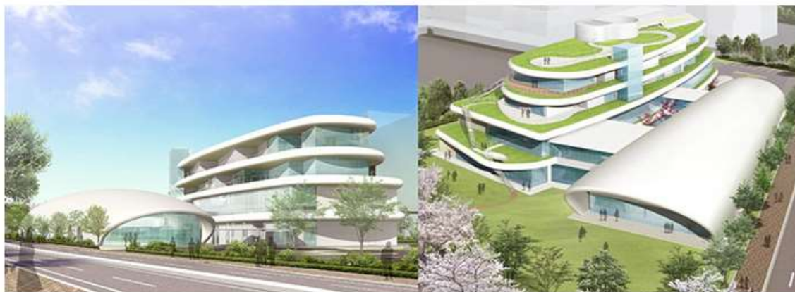
TOTOミュージアム 外観イメージ

TOTOミュージアムは創立100周年を迎え、快適な生活文化を創造してきたその足跡や、今へ受け継がれるものづくりへの思いなど、貴重な資料を展示、紹介する施設です。お客様およびお取引業者様、地域の方々との接点として、また創業の地「小倉」から世界へTOTOブランドを発信するランドマークとして、魅力ある施設を目指します。