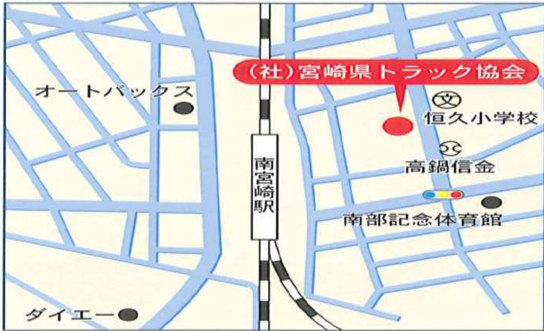
[ 宮崎県トラック協会周辺地図 ]